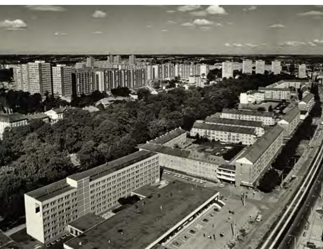
Bild 3: Die Freilichtbühne im Wohnkomplex Halbe Stadt