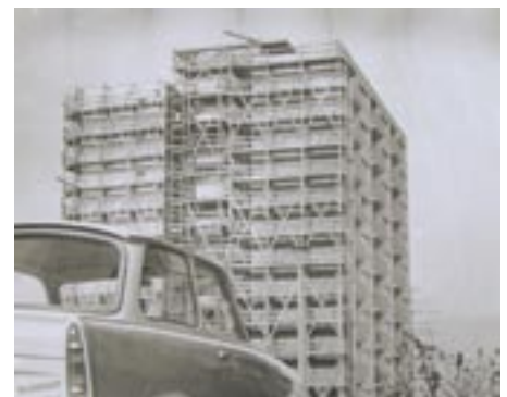
... hinter den Gerüsten wurde schon gewohnt.

So kann man bei der WOWI auch im Alter jung bleiben. Ein nachahmenswertes Beispiel, findet »WO Wlr wohnen«.