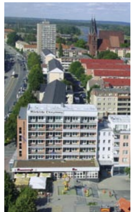
Ein schönes Stück Frankfurt: Der „Experimentalbau“ hat sich nach seinem Umbau zu einer begehrten Adresse entwickelt – und zu einem Blickfang im ‚neuen‘ alten Stadtzentrum.

Geduld beispielsweise, wenn die WOWI ihre Häuser und Wohnungen zu Baustellen machte. Schließlich galt es, die oft maroden Gebäude vom Dach bis zum Keller auf den Stand der Zeit zu bringen. Da machte die Erneuerung der kompletten Haustechnik vor den Bädern und Küchen der Mieter nicht halt, und auch die Neugestaltung von Fassaden, Eingängen und Treppenhäusern forderte zunächst Toleranz gegenüber Baulärm und Bauschmutz. Allein im Jahr 1998 wurde für über 26,6 Millionen Euro im WOWI-Bestand gebaut, und für insgesamt rund 2.000 Wohnungen konnte die WOWI bis zum 31. Juli 2005 melden: Komplettmodernisierung abgeschlossen. Die Mieterumfragen, die die Wohnungswirtschaft seit 1991 regelmäßig durchführt, zeigen, dass die Mieter des Unternehmens diese Entwicklung honorieren: Über die Hälfte sagen, dass sie mit ihrer Wohnsituation zufrieden sind. Ein weiteres Drittel bekennt sich teilweise zufrieden. Und das ist doch keine schlechte Bilanz nach 15 bewegten Jahren.