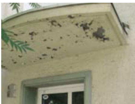
So sieht es in der Großen Oderstraße aus. Aber nicht mehr lange.

Freuen wird er sich in jedem Fall über eine gute Wohnadresse im Stadtzentrum, bei der die Adler-Apotheke gleich nebenan nicht nur eine bequeme Arzneiversorgung sichert, sondern auch den Anschluss an ein echtes Stück des alten Frankfurt.