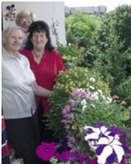
30 Jahre Seelower Kehre 10