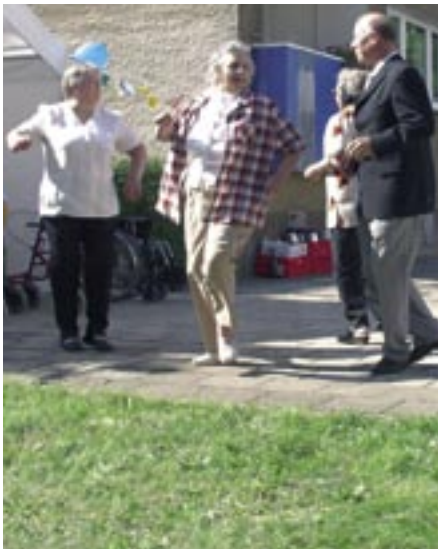
40 Jahre Winzerring 6