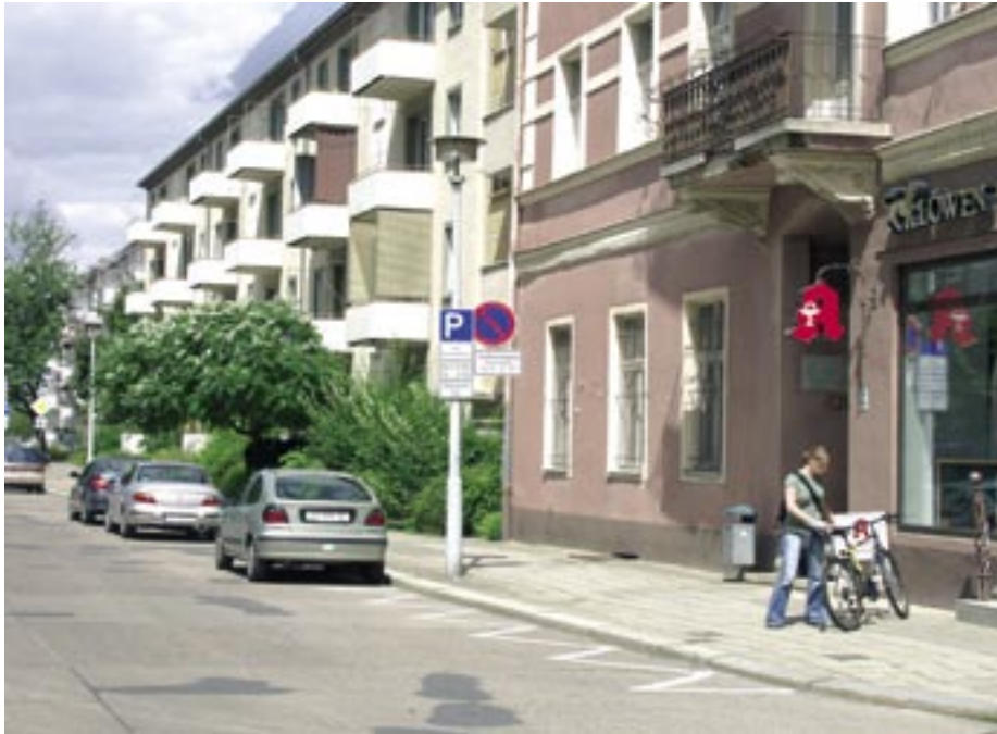
Ein Bauvorhaben in historischer Nachbarschaft: Die WOWI saniert eine Häuserzeile in der Großen Oderstraße.

Viel ist nicht mehr zu tun im Zentrum. In den vergangenen Jahren hat die Wohnungswirtschaft die Instandsetzung und Modernisierung ihrer Häuser zwischen Magistrale und Oder-ufer weit vorangebracht. Nun ist eine der letzten noch unsanierten Häuserzeile in der Großen Oderstraße an die Reihe gekommen. Die Verträge mit den Baubetrieben wurden am 12. September 2005 unterzeichnet.