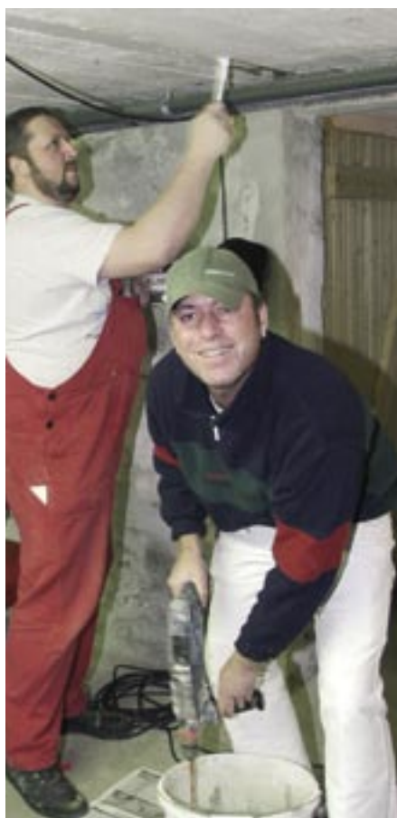
Mieter mit Initiative in ihrem Gemeinschaftskeller

WO Wlr wohnen« hat für die Idee geworben: Mieter machen in Eigenleistung ihre Häuser und deren Umgebung schöner. Im Herbst wurden am Juri-Gagarin-Ring in Süd Bäume gepflanzt und Blumenzwiebeln gesetzt. Nun setzt sich die Eigeninitiative der WOWI-Mieter in einem Kellerraum in der Nuhnen-Vorstadt fort.