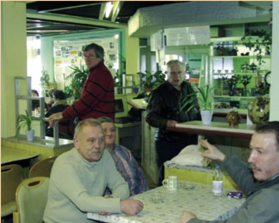
Freundliche Atmosphäre im »Domizil« ...

wurde und darum sofort zubereitet und verzehrt werden muss.