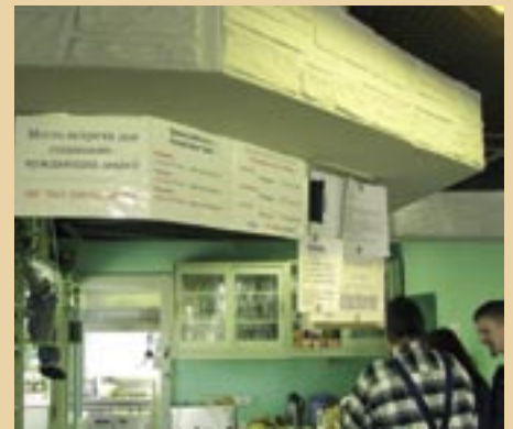
... und Hinweistafeln auch in kyrillischer Schrift für die zahlreicher werdenden russisch-sprachigen Besucher des Treffs